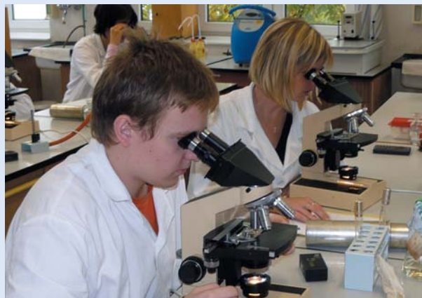
Praktická cvičení v laboratořích mikrobiologie