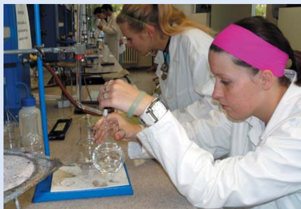
Praktická cvičení v laboratořích analytické chemie