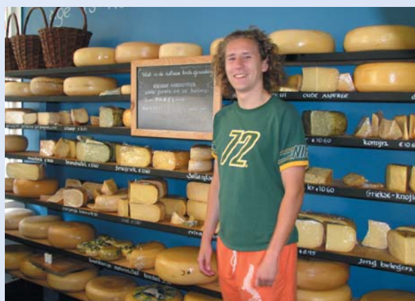
Zahraniční praxe studentů – holandská sýrařská farma