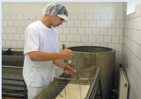
Výroba sýrů ve školním poloprovozu