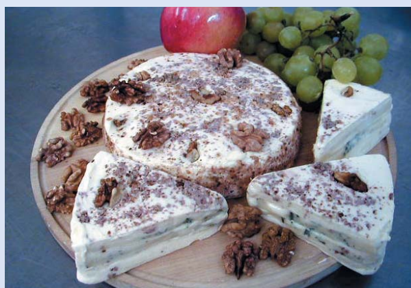
Tavený sýrový dort – výrobek školního poloprovozu