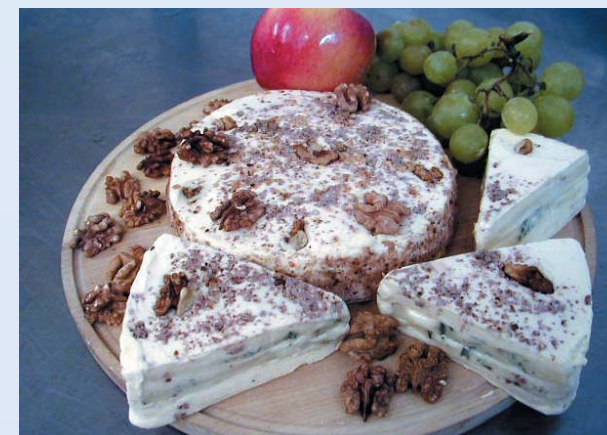
Tavený sýrový dort – výrobek školního poloprovozu