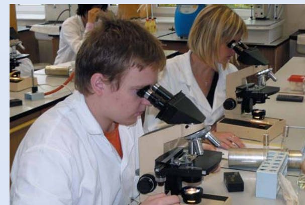
Praktická cvičení v laboratořích mikrobiologie